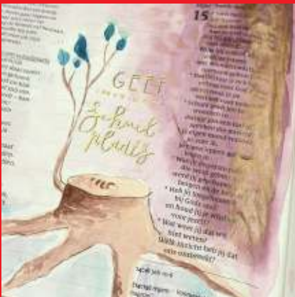
Tekening Marjolein Stové

opgave: een mailtje, telefoontje of appje naar predikant@pgsilvolde.nl of 06-48773774 / 0315-239910