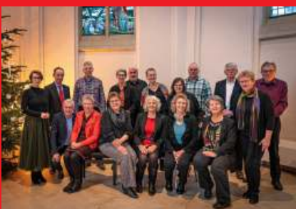
Vocaal Ensemble Encore

Zondag 3 november zijn er twee diensten. Dat is minder bijzonder dan ik in de Klavier deed voorkomen. Ik werd al snel op de vingers getikt dat Silvolde vroeger weliswaar geen avonddiensten kende maar dat er wel een tijdlang twee ochtenddiensten zijn geweest. Hoe dan ook, zondag 3 november is er een gewone ochtenddienst en 's avonds gaat de kerkdeur weer open. Een avonddienst met medewerking van Vocaal Ensemble Encore uit Varsseveld. Er zal ruimte zijn voor hun muziek, voor samenzang en voor lezingen die passen bij deze tijd van het jaar.