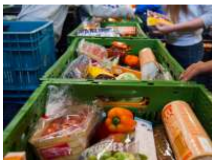
Collecte op Dankdag t.b.v. Voedselbank

Gedacht kan worden aan aandacht voor ouderen binnen onze gemeente en de deelkast.