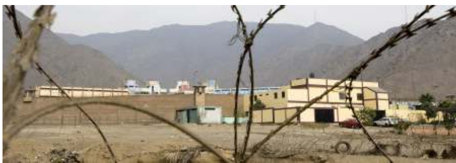
Epafra bezoekt Nederlandse gevangenen in buitenlandse detentie

Vluchtelingenwerk zorgt voor begeleiding en hulp aan vluchtelingen in onze regio, helpt hen met het invullen van formulieren en de weg naar allerlei instanties te vinden. Ook helpen ze bij gezinshereniging en regelen van financiën.