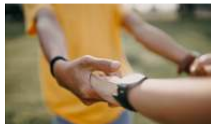
Collecte 28 april: Epafras, Gevangenispastoraat