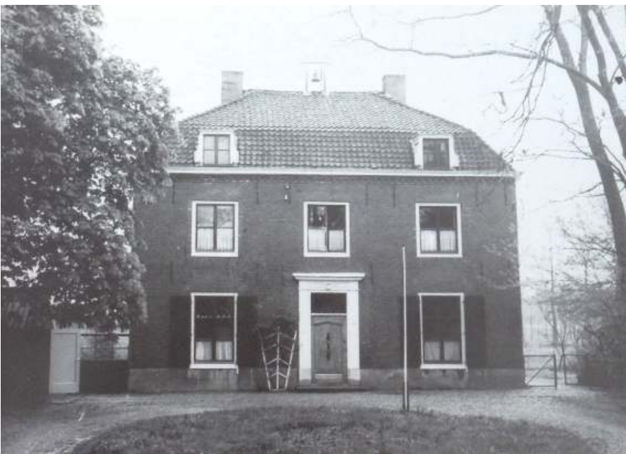
De oude pastorie

Bij het eerste het beste huis, waar een raam open stond vroeg ik of ik even telefoneren mocht en belde daar Wunderink op, die met het heugelijke nieuws bij Anneke kwam en een eind verder bij kennissen heb ik toen U en de marechaussee op gebeld.