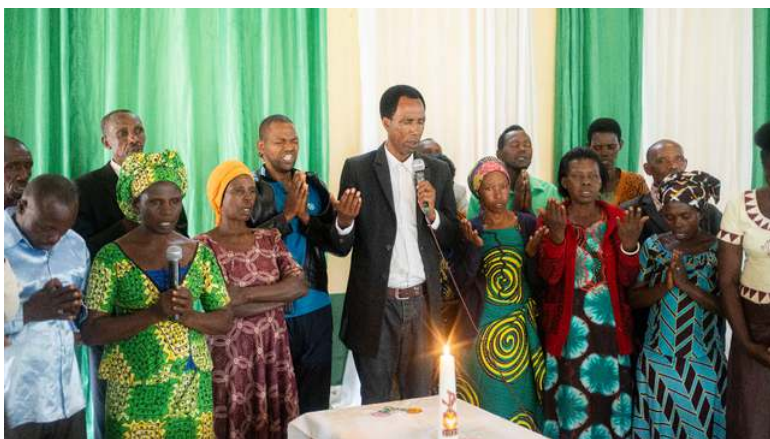
Collecte 14 april: Kerk in Actie, Rwanda, Kerk als plek van hoop, hulp en verzoening

Epafras zet zich in voor Nederlandse gevangenen die vastzitten in buitenlandse gevangenissen en biedt ze daar geestelijke steun.