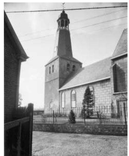
Onze kerk vóór de restauratie