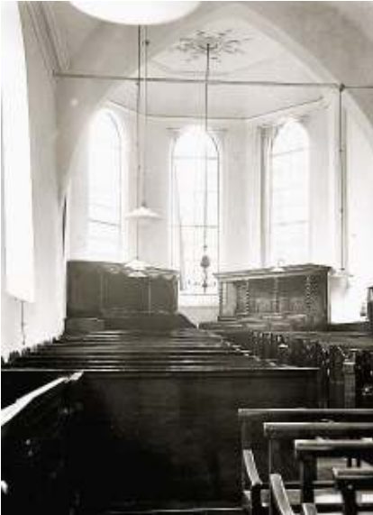
Kerkindeling van voor de restauratie van 1957, met de herenbanken voorin